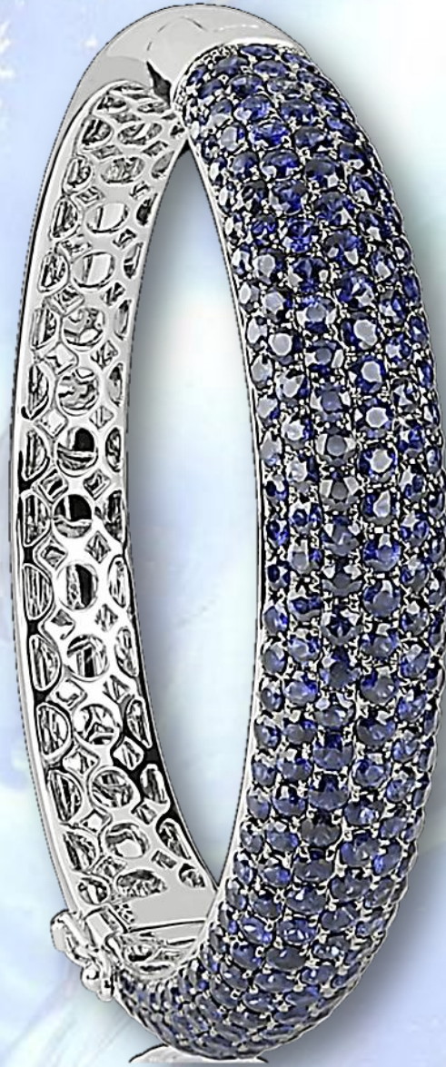
Weiß Gold Rugatec