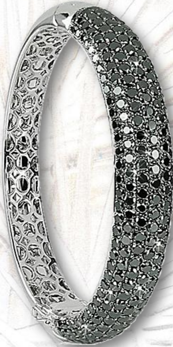
Weiß Gold Rugatec