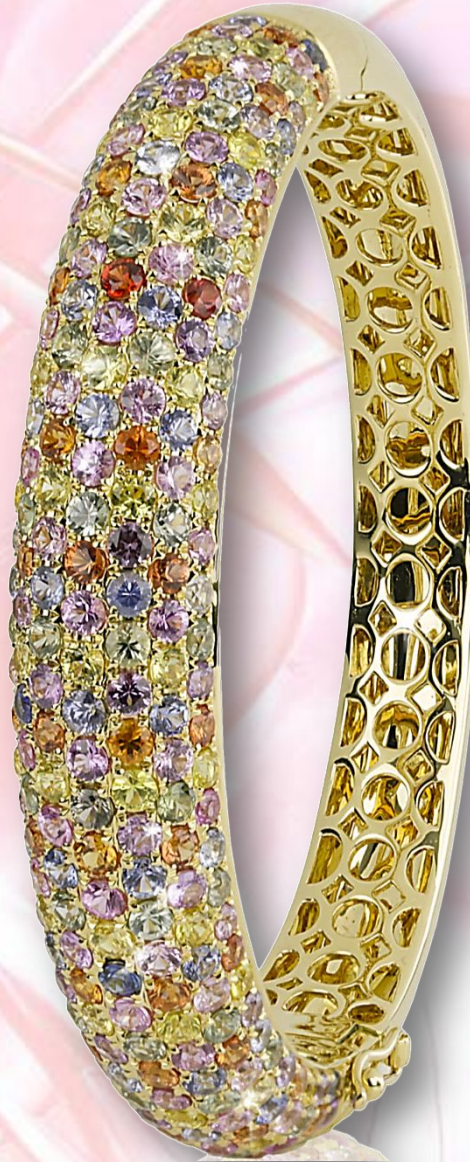
Saphir fancy 16,55 ct.