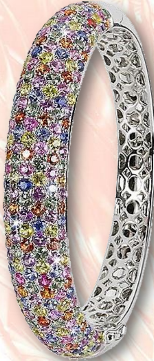
Saphir fancy 16,54 ct.