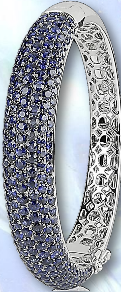
Saphir blau 16,61 ct.