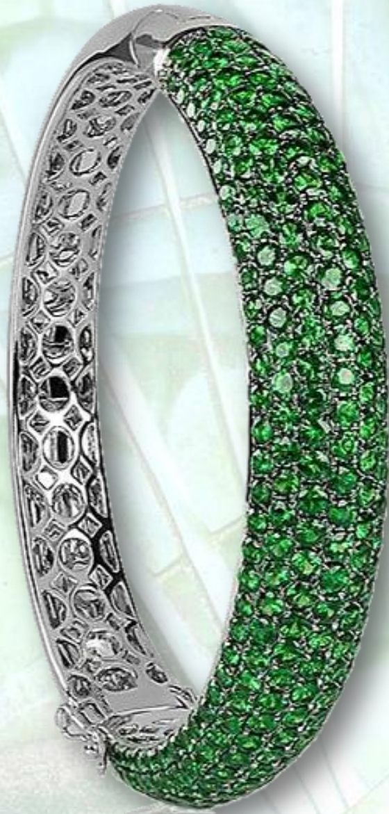
Weiß Gold Rugatec