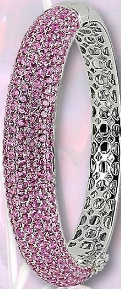
Saphir pink 16,49 ct.