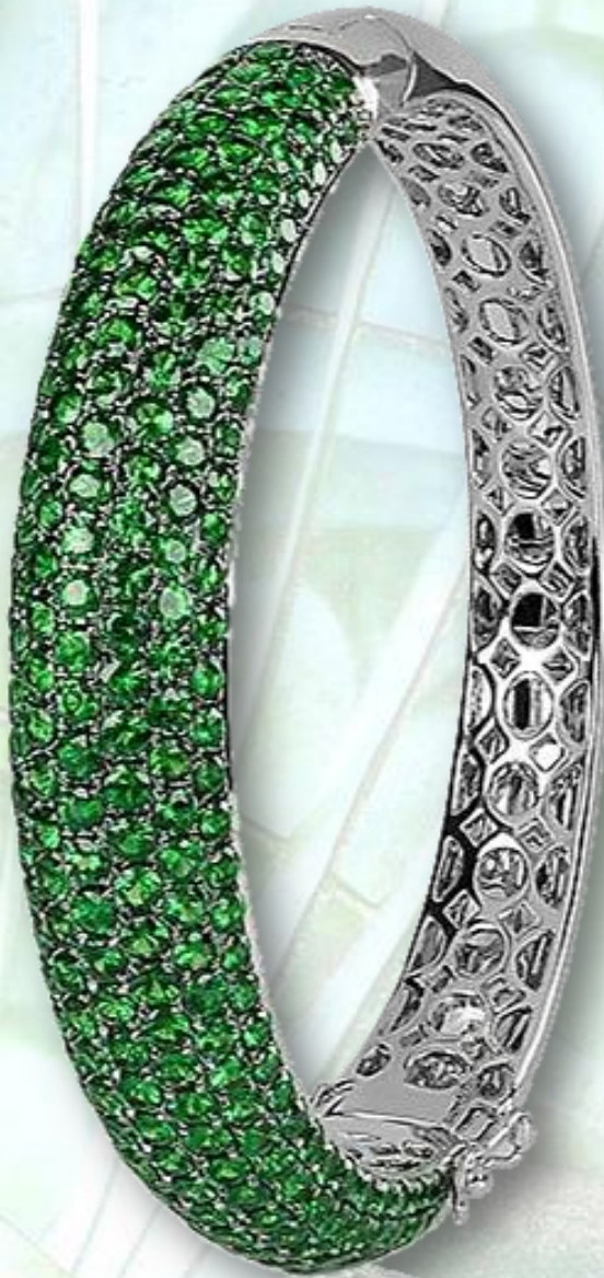
Tsavolith 16,60 ct.