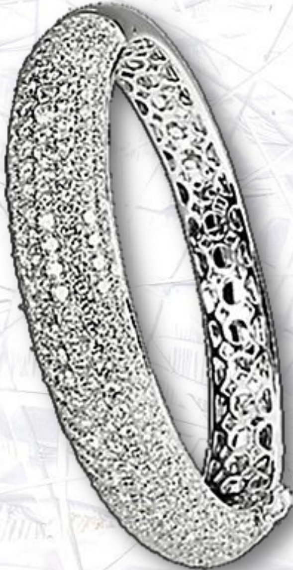
Brillant TW SI 13,35 ct.