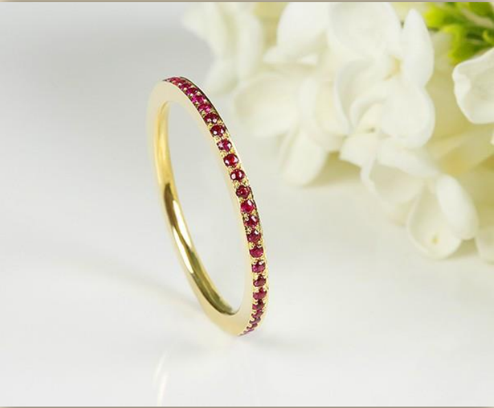
Gelb Gold Rubin