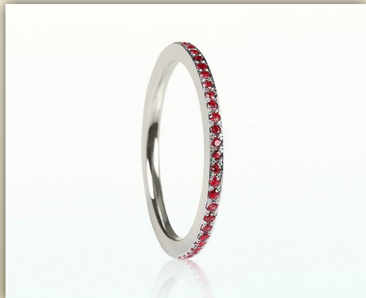
Weiß Gold Rubin