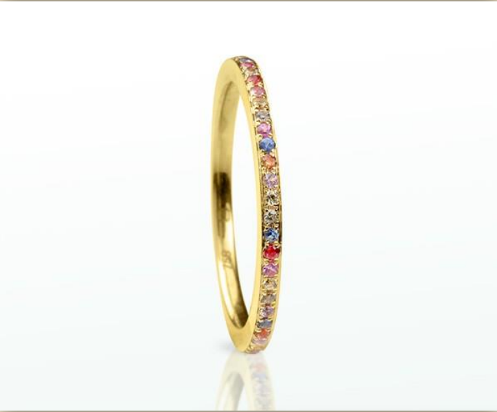
Gelb Gold Saphir fancy