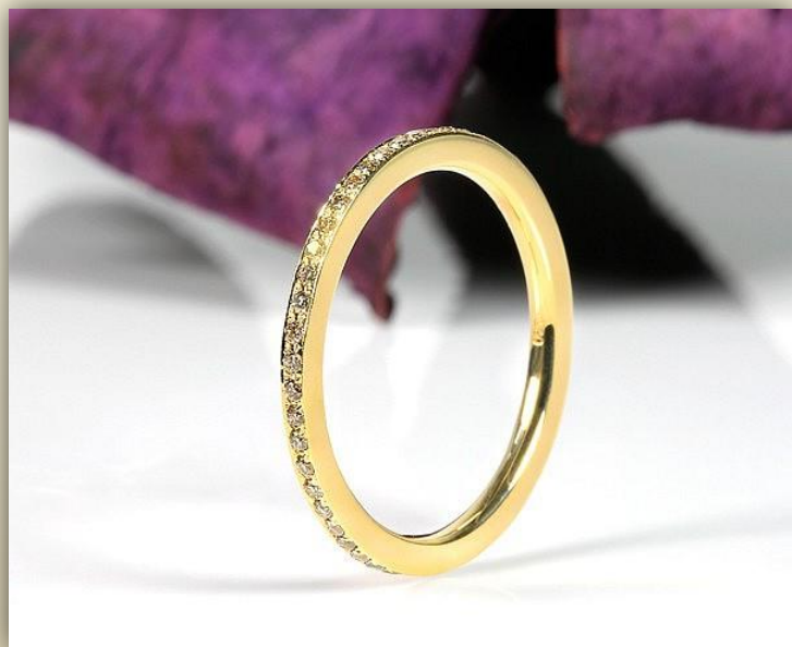
Gelb Gold Brillant braun SI