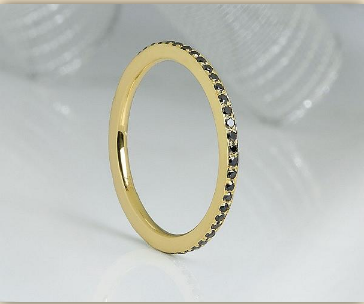
Gelb Gold Brillant schwarz behandelt