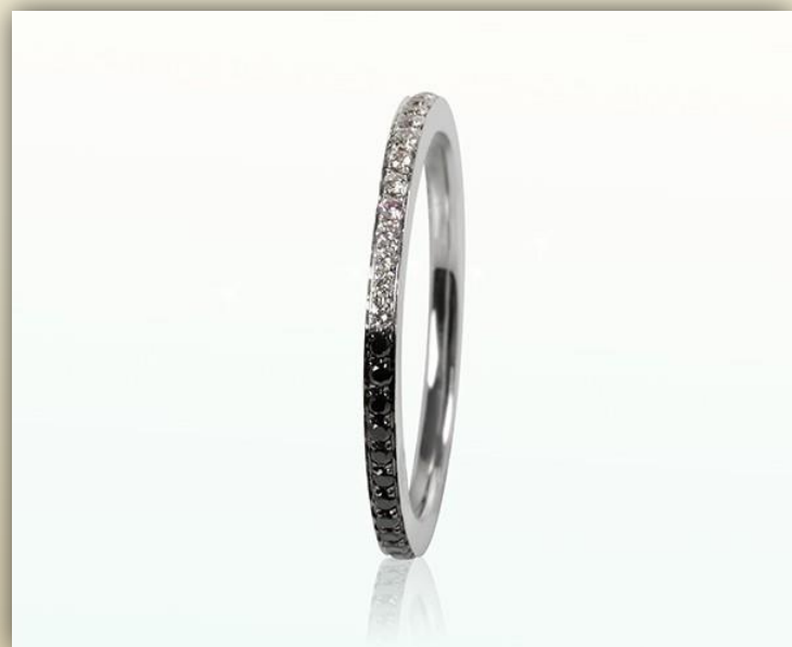
Weiß Gold Brillant Top Wesselton SI Brillant schwarz