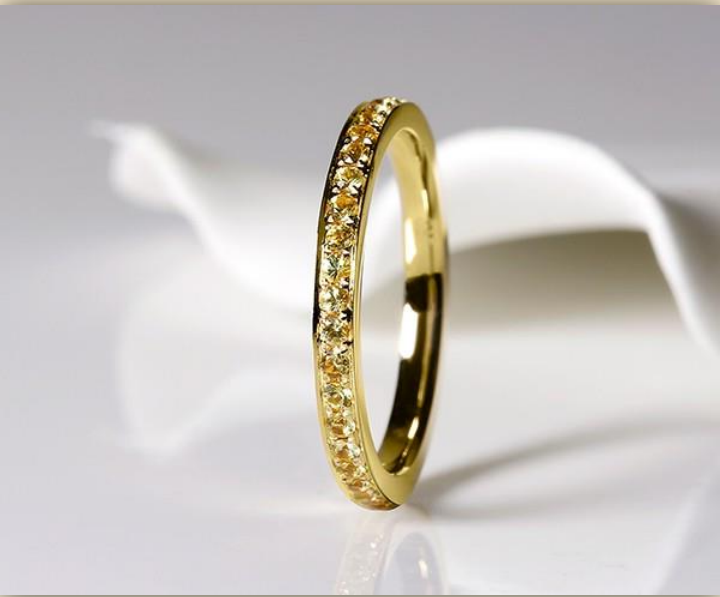
Gelb Gold Saphir gelb