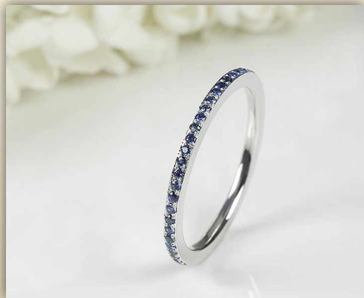
Weiß Gold Saphir blau