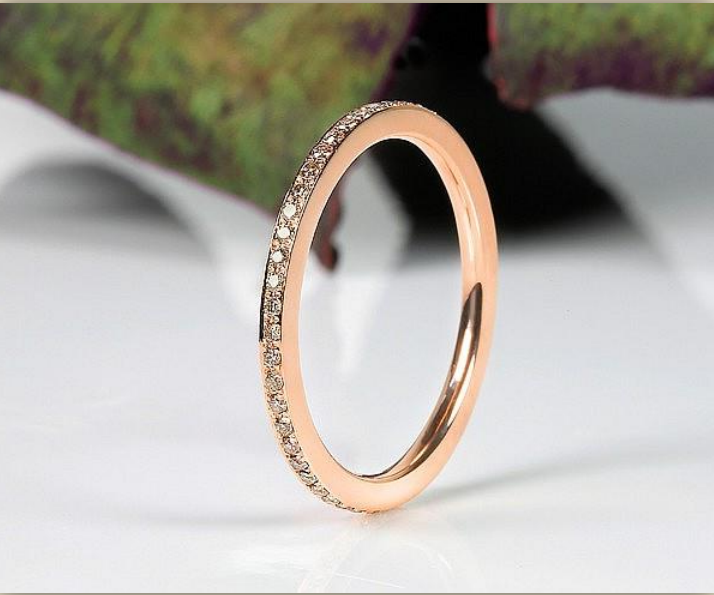
Rot Gold Brillant braun SI