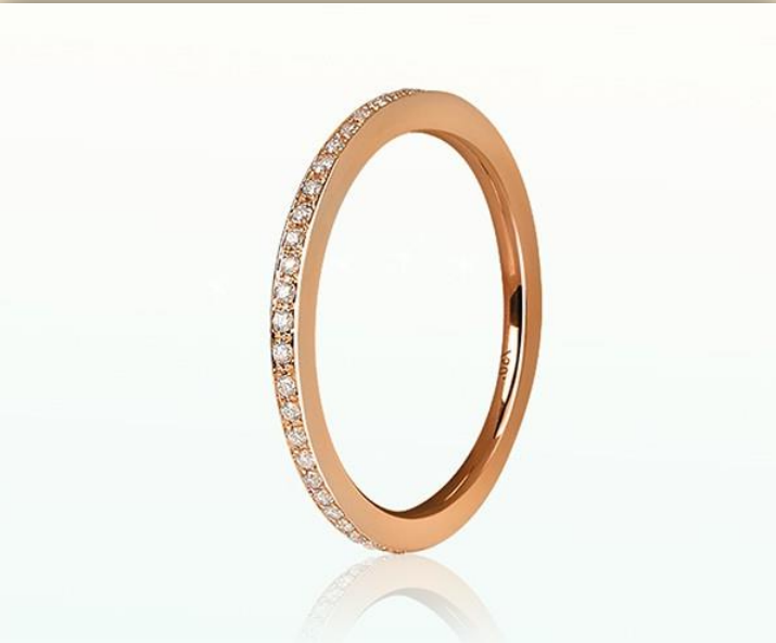
Rot Gold Brillant Top Wesselton SI