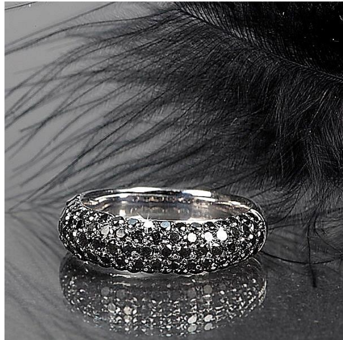
WeiB Gold Rugatec