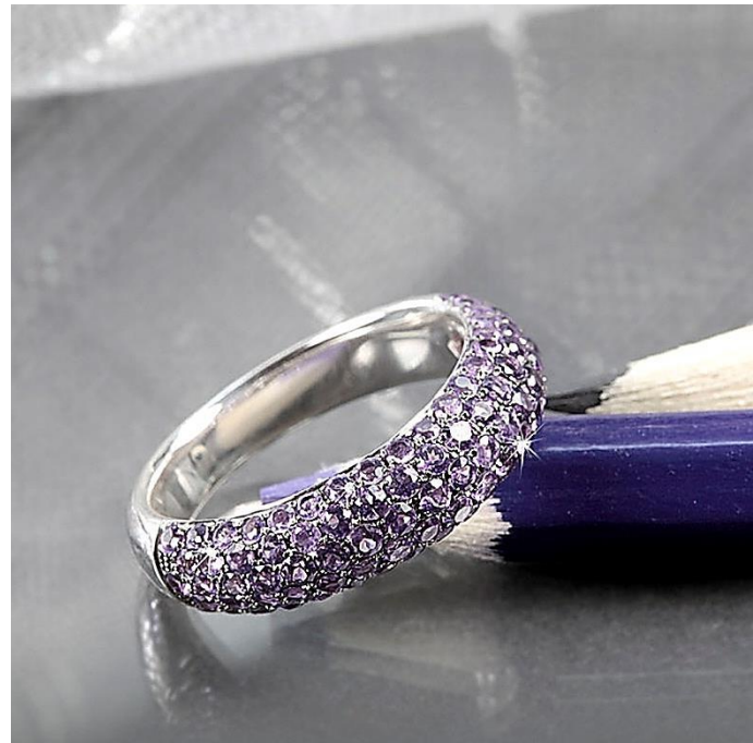
WeiB Gold Rugatec