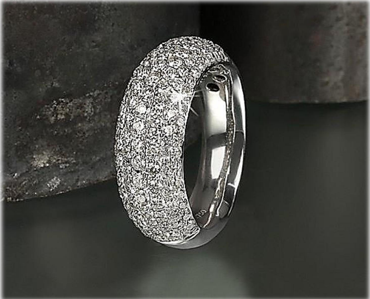
Diamant Top Wesselton SI 2,11 ct.