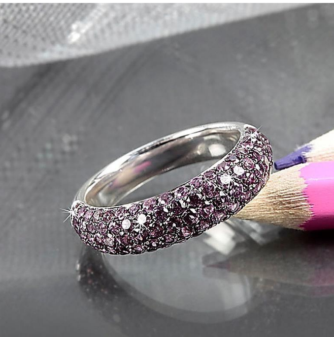
Weiß Gold Rugatec