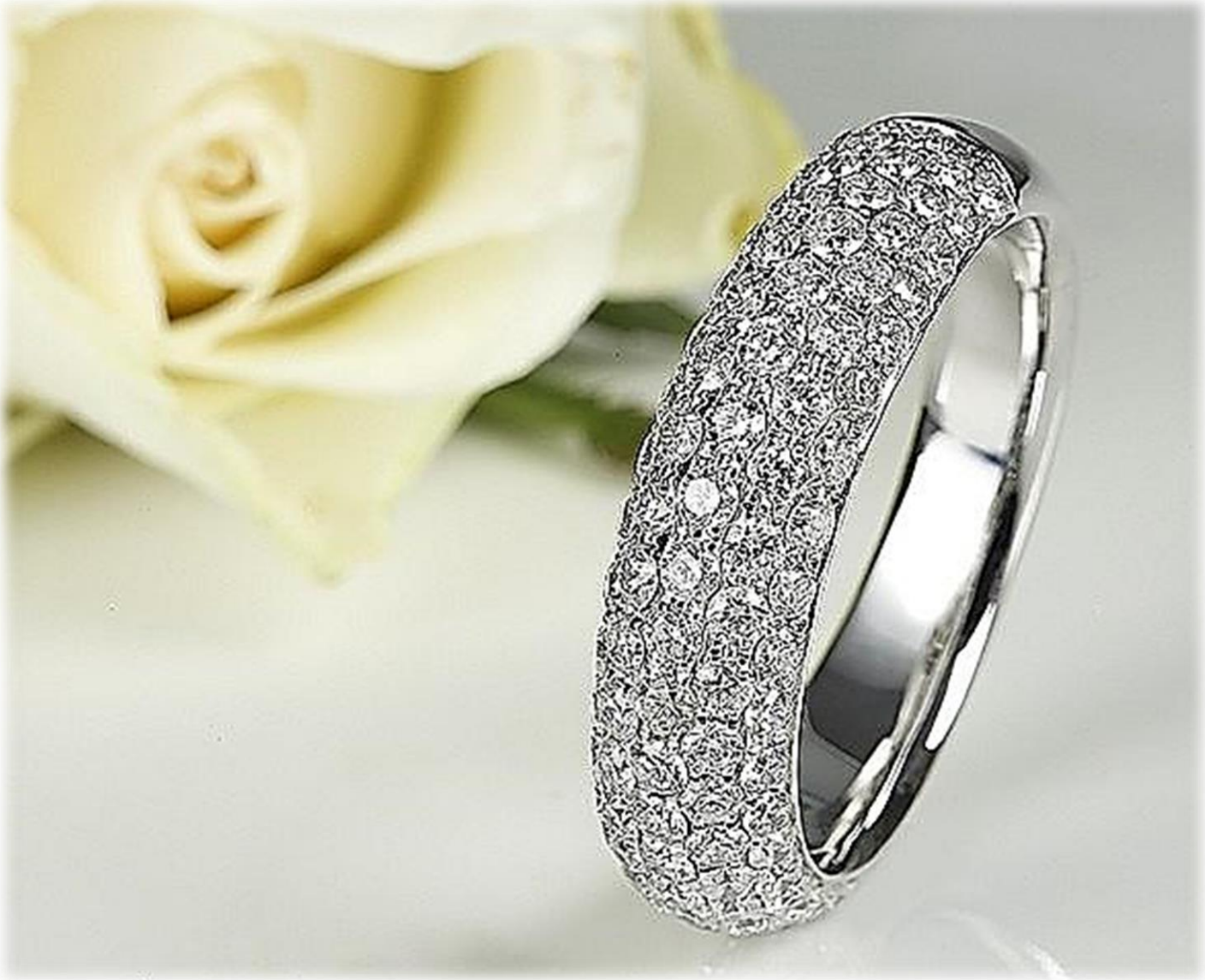
Diamant Top Wesselton SI 1,37 ct.